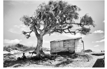
Christian BARBE (Paris)

Cette fiche d'inscription dûment complétée, signée et éventuellement accompagnée de votre chèque (5 €) libellé à l'ordre de « Secours des Hommes », [paiement par Paypal possible (5€ 50) sur le site de Secours des Hommes OU par virement bancaire : demander le RIB par mail], sont à envoyer par courrier à